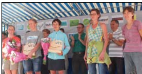
Le podium dames.