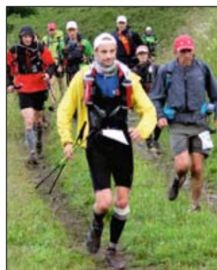
Quelques petites averses ont accompagné les coureurs le long du parcours, avant de retrouver le soleil en direction de Saint-Claude.