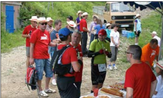
A Coyrière, les coureurs étaient accueillis dans une très bonne ambiance.