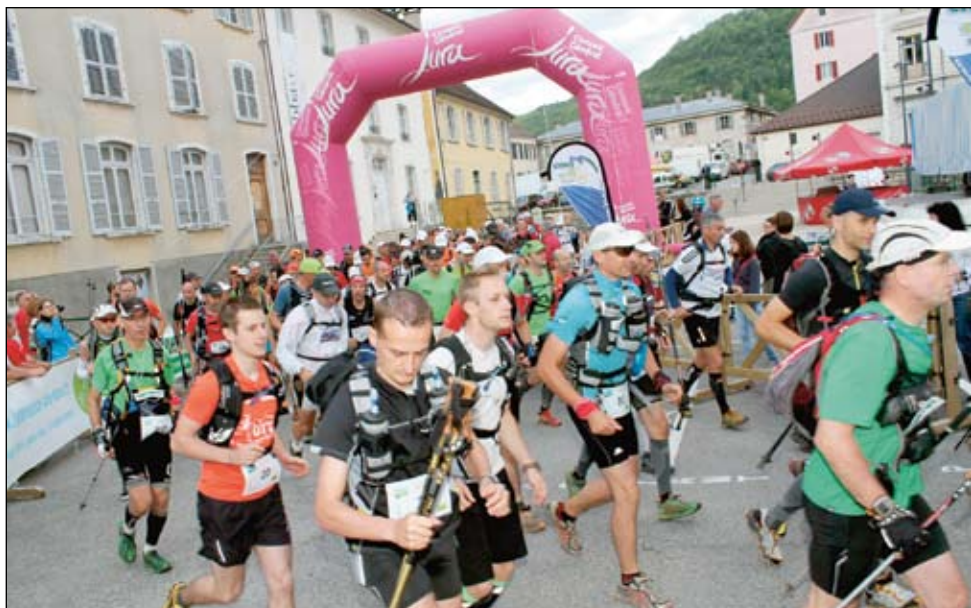
Départ du 2 e Ultra-Trail UTTJ, des 262 trailers devant le Musée de l'Abbaye.