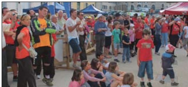
Le public nombreux assistait à la remise des prix.