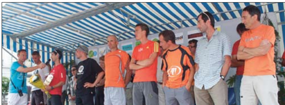
Le podium scratch hommes.